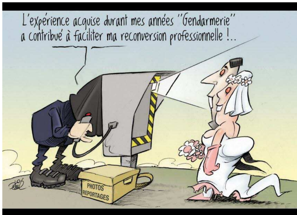
La reconversion des gendarmes vue par notre dessinateur. dessin Phil

Colmar accueille jeudi son premier forum emploi reconversion réservé aux militaires et gendarmes.